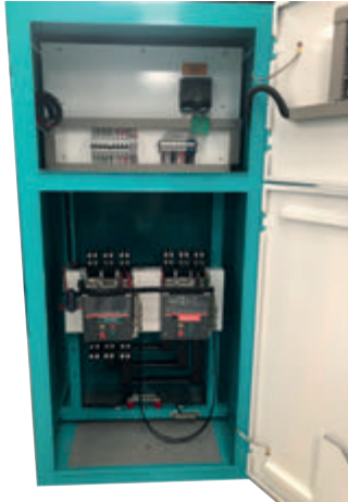
TABLERO DE CONTROL Y TRANSFERENCIA MCA GP TIPO AUTOSOPORTADO MODELO GP-C TIPO NEMA 1

El tablero de transferencia automático modelo GP-1250 (440 V) formado por interruptores electromagnético de 2000 Amp. tiene la función de arrancar, parar, proteger tanto el motor diesel como el generador eléctrico y hacer la transferencia y retransferencia de la carga de la red de CFE a la planta y viceversa por medio del módulo de control DSE-7320. Todo esto de forma automática o manual.